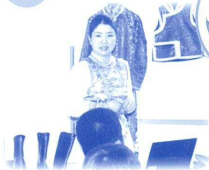
7月 モンゴルのお話

小学4年生から小学6年生までのメンバーが、月に一度、第2土曜日の午後、海外の方をゲストに招いて楽しく海外の文化を学んでいます。