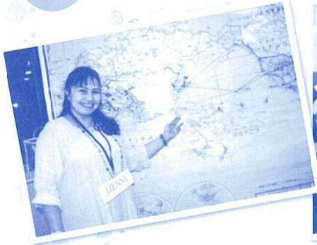
6月 フィリピンのお話 台風被害の様子