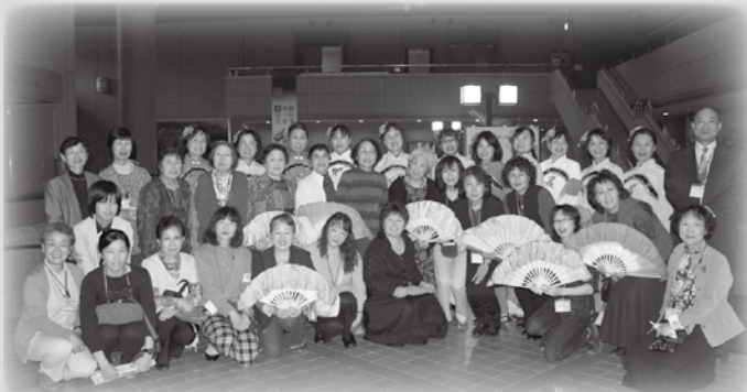
終了後、会員メンバーと一緒に記念撮影