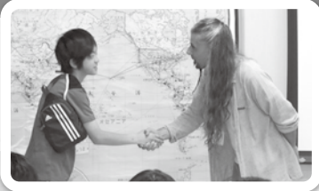
5月 アルゼンチンの話