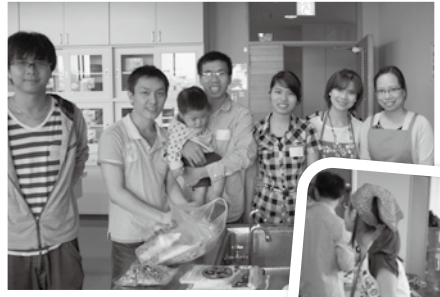
6月 ベトナム料理教室

小学4年生から小学6年生までのメンバーが、月に一度、第2土曜日の午後、海外の方をゲストに招いてゲームや料理をしながら楽しく海外の文化を学んでいます。