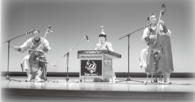
モンゴルの民族楽器演奏