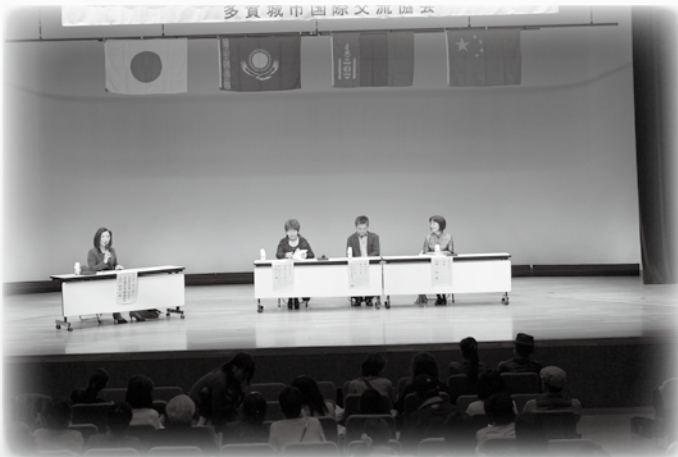
仙台在住の外国の方「宮城に住んでみて」ディスカッション

多賀城市文化センターを会場に世界のステージショーを市民の皆様をお迎えし、今年も華やかに行われました。