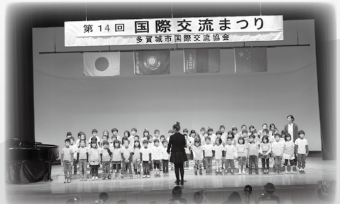
市内幼稚園児の合唱