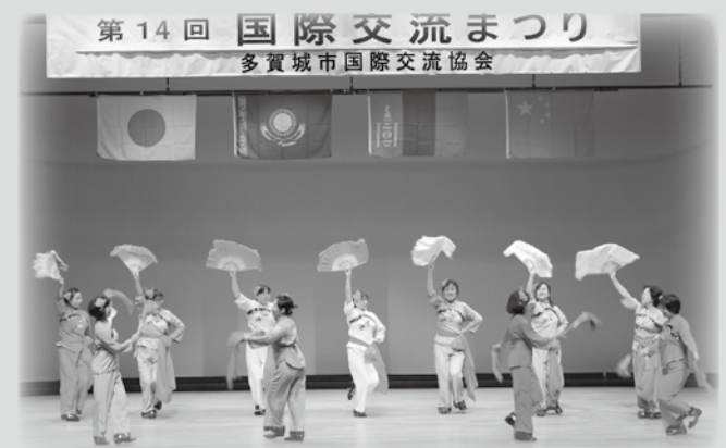
中国の「ヤンコ踊り」