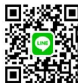
多賀城市公式LINEのQRコード