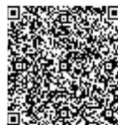
参加申込のQRコード