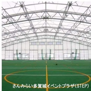
さんみらい多賀城イベントプラザ(STEP)