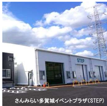
さんみらい多賀城イベントプラザ(STEP)