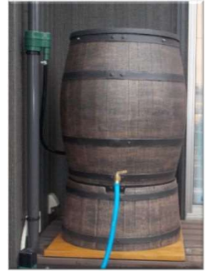
雨水貯留タンク施工例

1家庭でも多くの皆様が本制度を利用いただくことは、豪雨時の市全体の雨水被害の軽減にもつながりますので、ぜひご検討くださいますよう、お願いいたします。