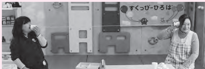
紙コップで遊ぼう