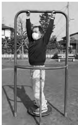
健康遊具でツイスト運動