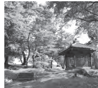
本市の原点といえる多賀城の創建を刻む多賀城碑

神亀元(西暦724)年に築かれた多賀城。奈良時代から平安時代にかけて、陸奥国府や鎮守府が置かれ、東北の文化、経済、政治の中心であり、多くのヒトやモノが行き交う文化の交流拠点でした。また蝦夷との交易を通じて北方の産物である馬・獣革・昆布などの受け入れ先でもあったのです。