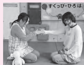
③たーたーいーてー つーねってー 優しく触ってね