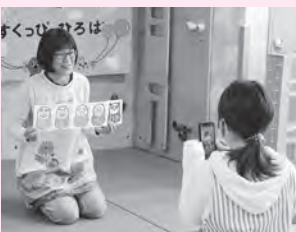
「だるまさんとらめっこ」の撮影。少し緊張感がありながらも、楽しそうに撮影していました。