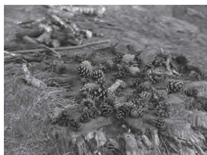
多賀城碑(壺の碑)近くの切り株の上に松ぼっくりがたくさん並べられていました。