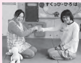
②(手のひら) こ~ちよこちよ~ 手のひらをくすぐる