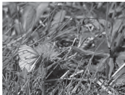
政庁跡に咲いたんぽぼにモンシロチョウが止まって羽を休めていました。