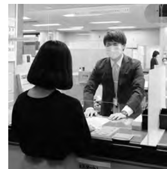
アクリル製パネルを設置した窓口対応の様子

さらに、国内の感染者が増加したことから、16日には緊急事態宣言の対象地域が全都道府県に拡大されました。 終息が見えない今、気軽に外出ができず、つらい状況が続いています。その中で一人一人が①手洗いうがいを徹底する②3つの密「換気の悪い密閉空間」「多数が集まる密集場所」「間近で会話や発声をする密接場面」を避けることで、感染拡大を止める一歩になります。今できる予防策を行い、市民一丸となって乗り切りましょう。