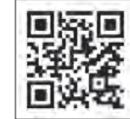
▲経済産業省ホームページ

国・県において低利または無利子の融資制度が設けられました。融資条件などの内容は、次のホームページをご確認ください。