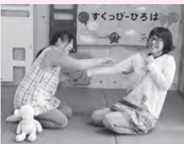
④(2本指で)階段昇って~ 2本指で腕をのぼっていく ※少し大きい子は階段を昇り下りするとドキドキがアップするよ