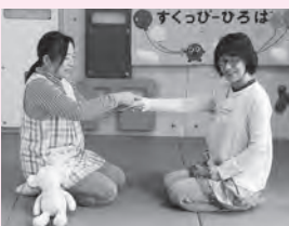
①1本橋~ 手のひらに1本指で線をかく