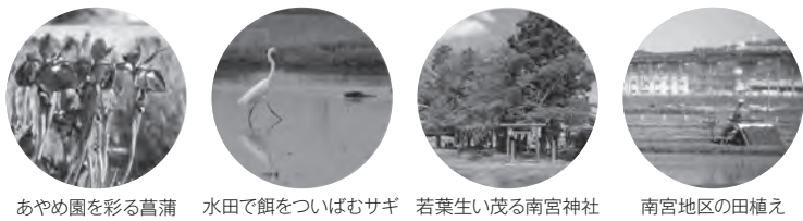
あやめ園を彩る菖蒲 水田で餌をついばむサギ 若葉生い茂る南宮神社 南宮地区の田植え