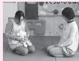
小さい子は膝の上に乗せて 優しくさわってあげてね