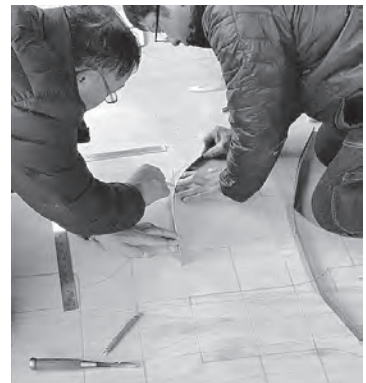
原寸図の作製(岩手県遠野市)

この原寸図を基に作った型板を材木に当てて、各部材の形を書き写し、加工していきます。