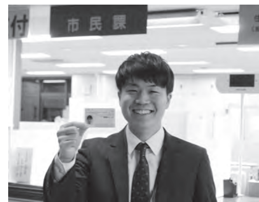
交付通知書(はがき)が届いている人はマイナンバーカードを受け取りに来てください