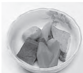
奈良県の郷土料理

2月実施の友好都市メニューは、奈良県奈良市の郷土料理「権座(ごんざ)」です。「ごった煮」がなまって「ごんざ」になりました。また、秋祭りに氏神様と共に頂くという意味とも言われています。たくさんの野菜を使った煮物です。