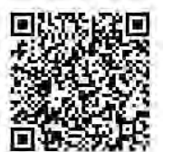
▲国税庁ホームページ 確定申告書等作成コーナー