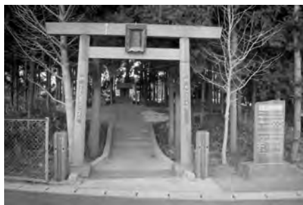
鞘堂が建てられる前の冠川神社

冠川神社は、本市の西部、新田字南関合に鎮座する神社です。冠川とは七北田川の別名で、神社のある場所は、七北田川まで100メートル足らずという、川沿いの地です。 中世の多賀城市を語る上で欠かせない資料「留守家文書」には、「河原宿五日市場」「冠屋市場」の二つの市場名が登場します。このうち、神社のある辺りが、冠屋市場の故地とする考えがあり、境内に2基の板碑があるのも、中世との関わりを伺わせます。 安永3年(1774年)に作成された新田村風土記御用書出によれば、社殿・鳥居ともに南向きと記されています。社殿の規模は3尺四方、社名は村鎮守「稻荷社」で、「稻荷」と呼ばれた場所立っていました。祭日は9月15日でした。 平成26年度に実施した陸奥総社宮の建築学的調査の際、稻荷社の棟札2点を確認しており、1点には明治10年9月に「稻荷神社本宮」を「改正」すなわち修理したことが記され、もう1点には明治21年9月に「冠稻荷神社奥殿新建立」とあり、行き届いた管理がなされ