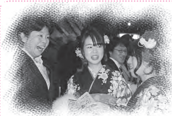
久しぶりの恩師との再会