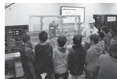
減災技術見学会の様子

平成27年12月25日、ソニー(株)仙台テクノロジーセンターおよびその構内にあるみやぎ復興パークで、「第5回減災技術見学会」を開催し市内の小学生ら11人が参加しました。