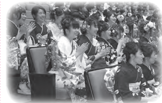
思い出に残る成人式になりました