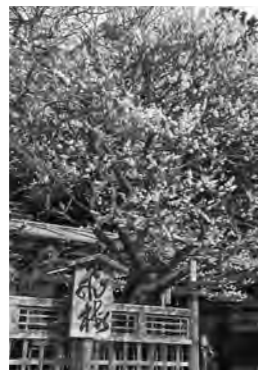
太宰府天満宮の飛梅

飛梅は、太宰府天満宮に約200種、約6,000本あるといわれる梅の中でも、最も早く開花することで知られ、春の訪れを告げる福岡の風物詩ともなっています。