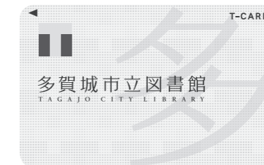
②多賀城市立図書館利用カード (Tカード機能付き)