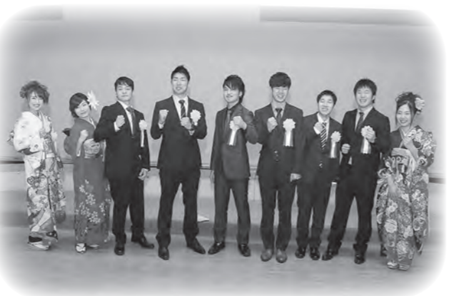
成人式実行委員会の皆さん

式典では、成人代表のあいさつや中学校時代の思い出のスライド上映、恩師の温かいスピーチが行われました。