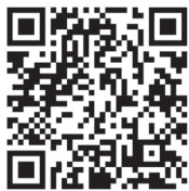
ことばのアートプロジェクトHP