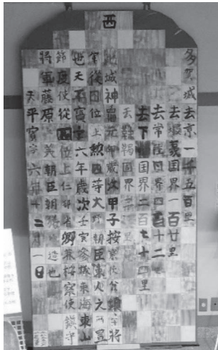
令和元年には「書」で表す「令和の多賀城碑」を実施しました。

141人がそれぞれの文字からのひらめきで表現した版画を再編集させた「令和の多賀城碑」が、いったいどんな姿になるのか、ぜひご覧ください。