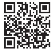
ことばのシンポジウム オープニングムービー