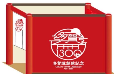
← 「ヨリ未知ポータル」 に設置予定のオブジェイ メージ （南門入口をイメージ）