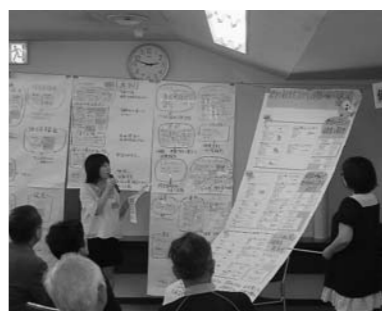
■これまでの結果を熱く発表しています