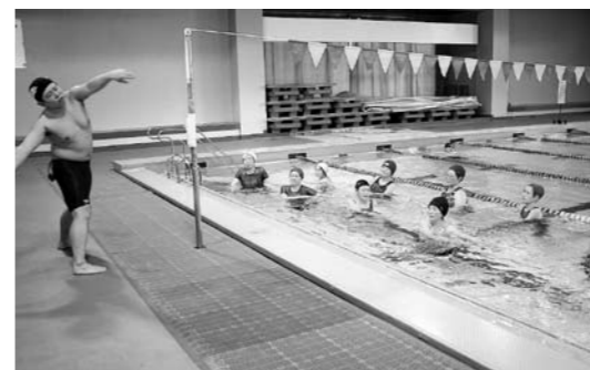
■昨年の水中ウォーキング教室の様子

期間/9月17日～11月26日の木曜日(全10回、9月24日をのぞく)午前9時50分受付、2時間程度 会場/市民プール 対象・定員/65歳以上で次のすべてにあてはまる方15人(先着順) ①腰痛や膝痛などで以前より歩くことができなかった方②介護保険の認定を受けていない方③過去に市の水中ウォーキング教室に参加したことのない方 費用/1,000円(保険料) 申込・問/8月13日(木)まで健康課成人保健係へ 内線 132/134