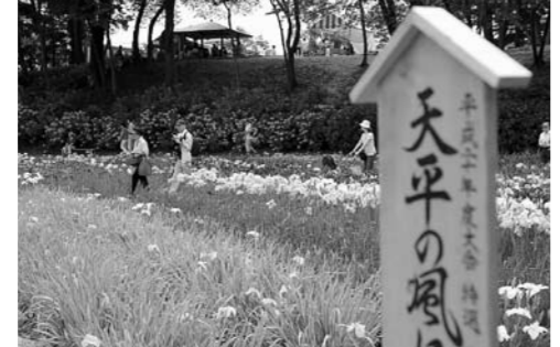
特選第一席の句は、次回の会場に掲示されるわ。