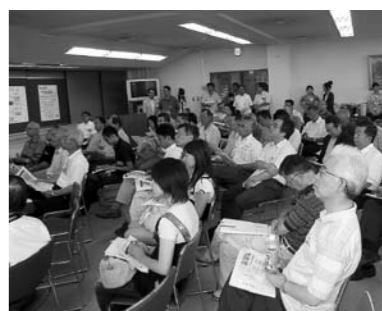
■真剣に耳を傾ける参加者の皆さん

として、少しでも役に立てればとの考えから、1日1便、平日の午後4時50分に岩切駅を出発し、市内西部地区へ帰宅する方をお送りしています。従来の万葉号よりもひとまわり大きいバスで、どなたでも無料で利用できます。運行ルート/岩切駅→サンクス多賀城新田店付近→新田レオパレス付近→美容室オリブ付近→関合橋付近→発向興業付近 ◆西部地区内運行後、バスは多賀城北日本自動車学院へ戻ります。問/多賀城北日本自動車学院 ☎0120・55・8703