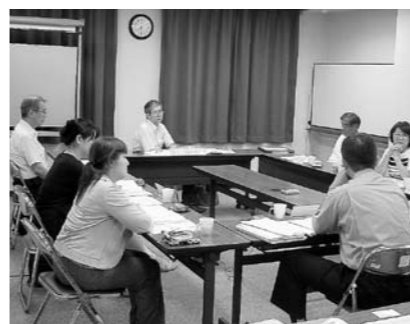
■行政改革推進委員会議の様子

◆申込・問/市長公室行政経営担当で配布する申込書(市ホームページからもダウンロード可)に必要事項を記入の上、8月20日(木)まで同室へ直接 内線213、214 Eメール/ kaikaku@city.tagajo.miyagi.jp