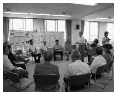
■発表後に参加者同士でこれからの多賀城を語り合いました