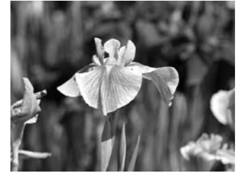
わたしはたくさんの太陽を浴びて輝きました。

あやめ園いっぱい咲き誇る250種、200万本のあやめ、花菖蒲が、せた第23回多賀城跡あやめまつり。祭りの後の静けさの中、再びあやめ園を訪ね、あやめに、今の心境取材いたしました。あやめは何を思い、何を私たちに語りかけてくれるでしょうか。