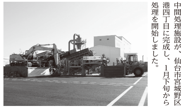
中間処理施設が、仙台市宮城野区港四丁目に完成し、1月下旬から処理を開始しました。

さまに對しては、すでに給付申請の続きのご案内をしています。万が一、届いていない場合は、ご連絡ください。 なお、埋火葬費用給付申請の対象者は次のとおりです。 条件 〇震災により被災し亡くなった多賀城市民の方のご遺体を、平成23年9月30日までに火葬したご遺族。②震災と直接関係がない通常死(老衰、病死、事故死など)で亡くなった多賀城市民の方のご遺体を、平成23年4月30日までに火葬したご遺族。 受付期間 〇2月29日(水)まで 〇生活環境課総務企画係 内線232、233