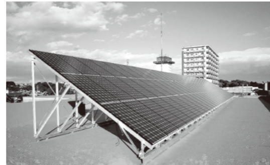
▲城南小学校のソーラーパネル

問/管財課施設経営係 内線461 今後は、公民館などにも太陽光発電システムの導入を進めていく予定です。