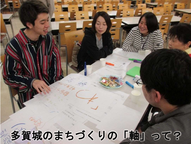
多賀城のまちづくりの「軸」って？