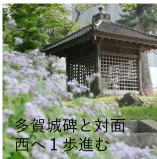
多賀城碑と対面 西へ1歩進む