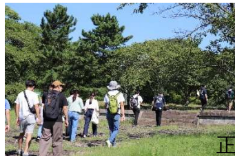
正殿をって 政庁跡をしゅっぱつ! 2歩進む