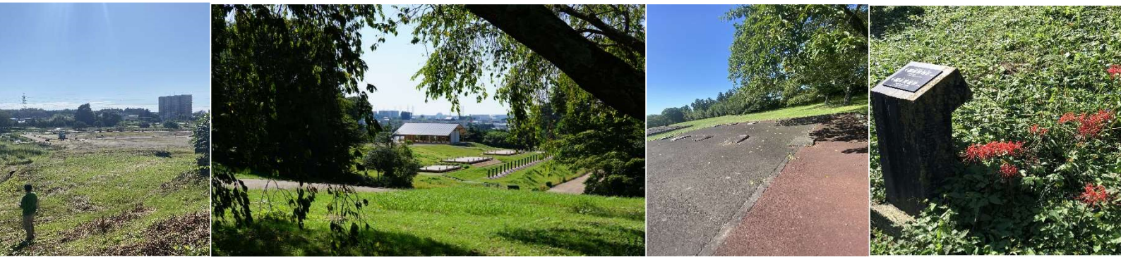
①晴れ渡るブルースカイ ②あそこは何になるのかな。 ③あか、みどり、あお ④曼珠沙華がお出迎え