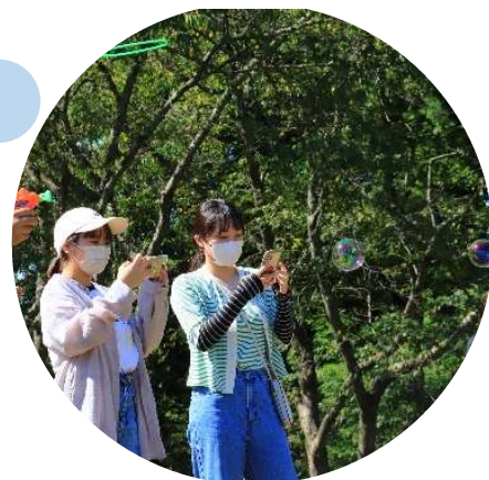
多賀城跡で しゃぼん遊び 1歩戻る