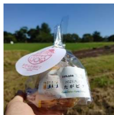
お菓子を食べて一回やすみ