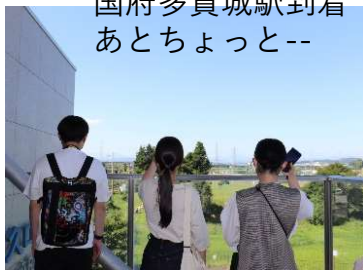
多賀城跡の玄関口 国府多賀城駅到着 あとちょっと--