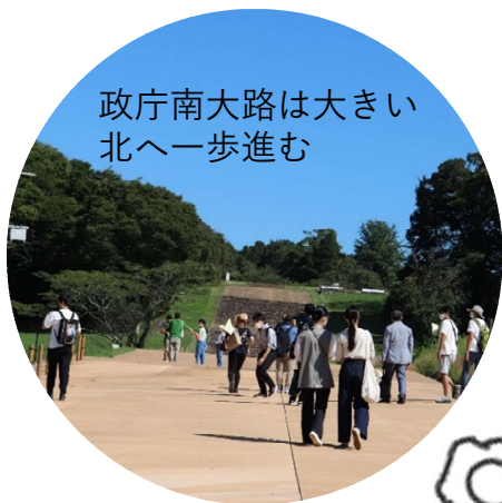
政庁南大路は大きい 北へ一歩進む

ピクニック いつ振りだろうね 澄み渡る青空が私たちを迎えているよう これ以上ない撮影ひよりに、 参加者のみなさんもワクワク、ドキドキ 短パンの市長も優しく見守っていました。