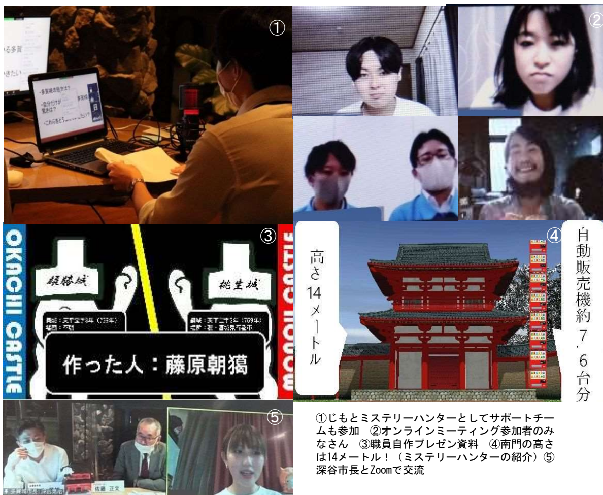
①じもとミステリーハンターとしてサポートチームも参加 ②オンラインミーティング参加者のみなさん ③職員自作プレゼン資料 ④南門の高さは14メートル！（ミステリーハンターの紹介）⑤深谷市長とZoomで交流

第2弾となる今回は、9月30日、Zoomでのオンラインミーティングで、U29の参加した若人13人と共に、開催しました。