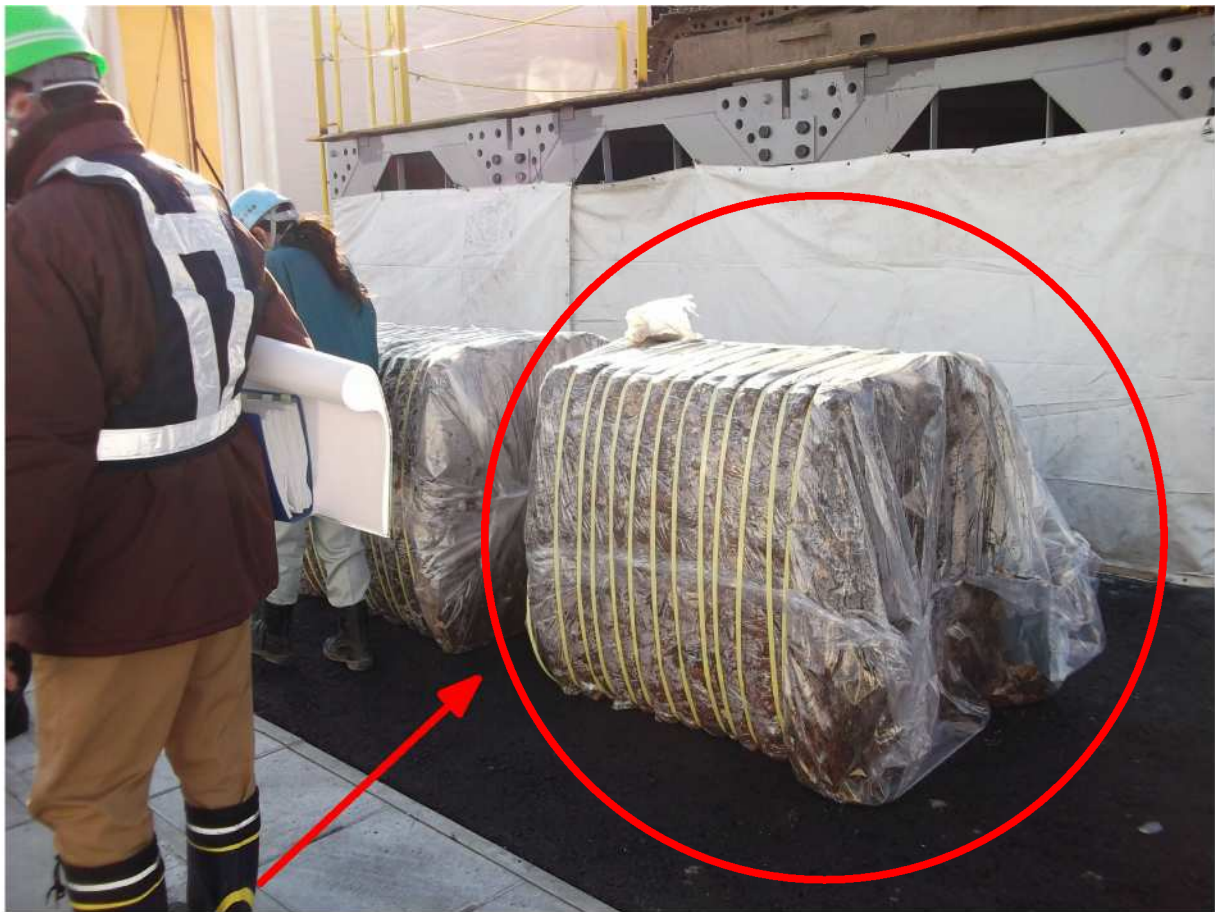
粗大系可燃物の圧縮梱包材の大きさは、概ね1メートルの立方体で重さは平均700kg