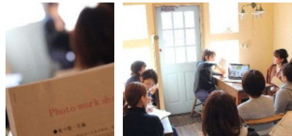
若者が企画実施の写真女子WSの様様！