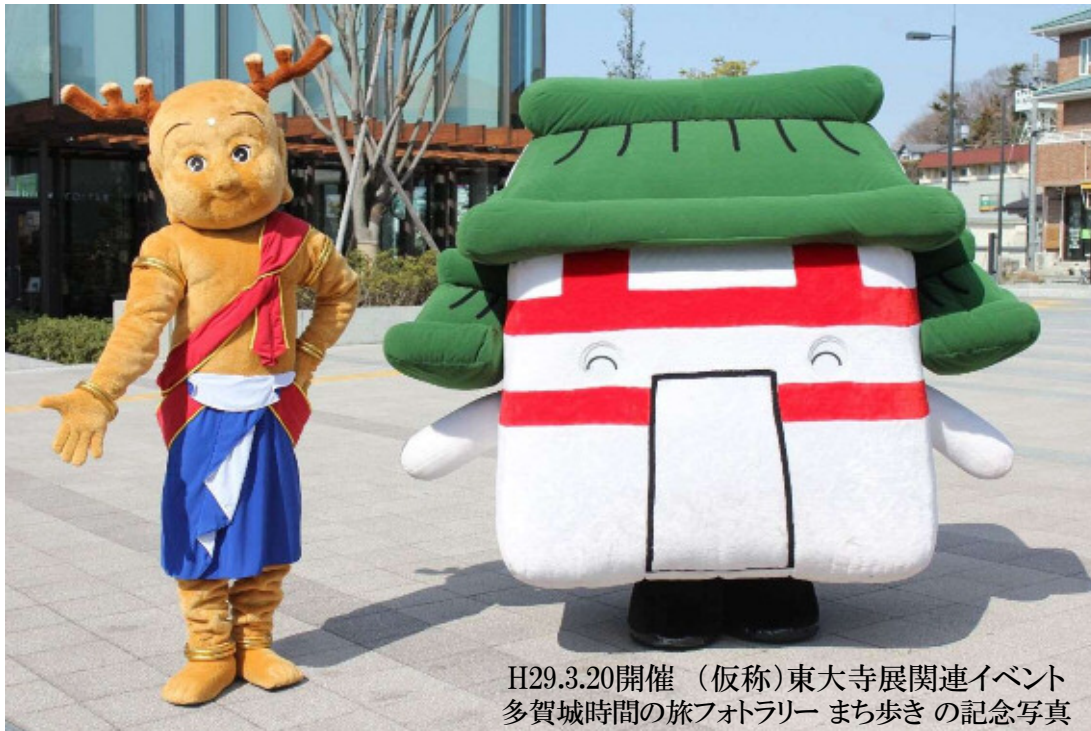
H29.3.20開催（仮称）東大寺展関連イベント 多賀城時間の旅フォトラリー まち歩きの記念写真