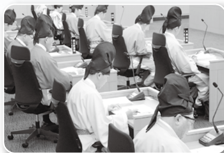
議会での審議の様子