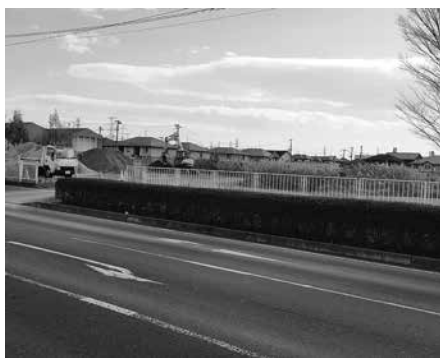
▲高橋地区の近隣公園

答3 厚生労働省の動向を確認するとともに、塩釜医師会及び塩釜管内の構成市町とも意見交換し、調査研究をしていきます。