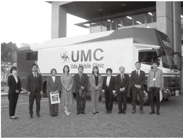
宇陀市移動診療車

令和4年5月から宇陀市立病院が医師とともに移動診療車UMC（UDA・MOUBIRU・CURIN ICの略）で、市民のもとへ伺い、診察、健診を行っています。宇陀市立病院と宇陀市が本気になって協力し合い、高齢化と山間部の状況などから、住民の健康と命を守る取り組みとして、ICTや医療機械設備を投入して、どこにもない画期的な移動診療車を導入したご努力に敬意を