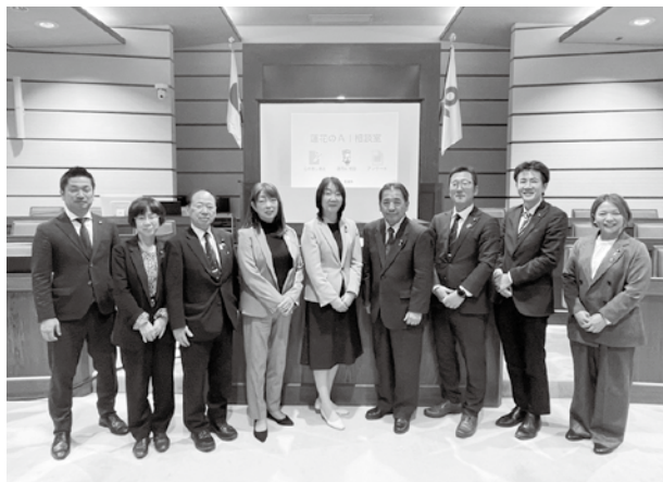
葛城市議会議場において

知度のあるSNS相談とAI相談システムを導入。AIによる書き込まれた日記の分析等により児童生徒の不安な状況やリスクを早期発見につなげる取り組みです。