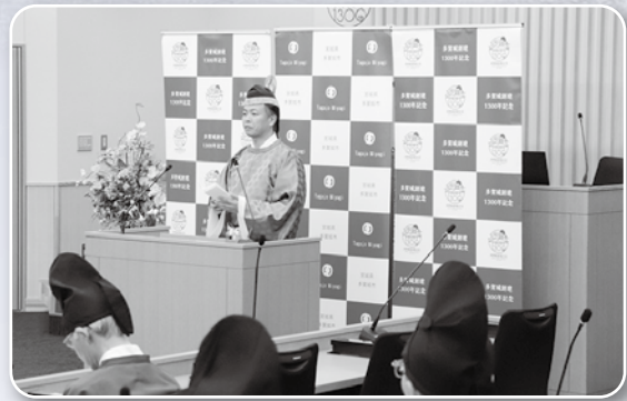
深谷 晃祐 市長