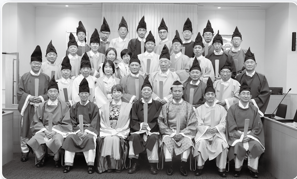
議会出席者による開場式後の記念撮影

議員一同、気持ちを新たに言論の府としての役割を果たしていくことをお約束申し上げます。