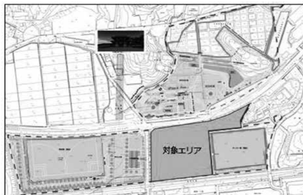
▲Park-PFI導入予定地の中央公園

質 公共施設等総合管理計画に合わせ、今後業務の変更の可能性があると思いますが、いかがですか。