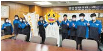
生徒会キャラクターの「サンシャインくん」

今回御紹介するのは、高崎中学校生徒会役員の方です。皆さんに、「生徒会の活動」、「高崎中学校の自慢」や「多賀城市の魅力」などについてインタビューしました。