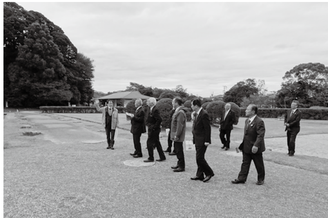
大宰府政庁跡において

11月13日福岡県太宰府市にて「観光行政について」、11月14日福岡県久留米市にて「農業振興策について」調査、福岡市にて「福岡市博物館」視察、11月15日福岡市にて「福岡県営天神中央公園」を視察しました。