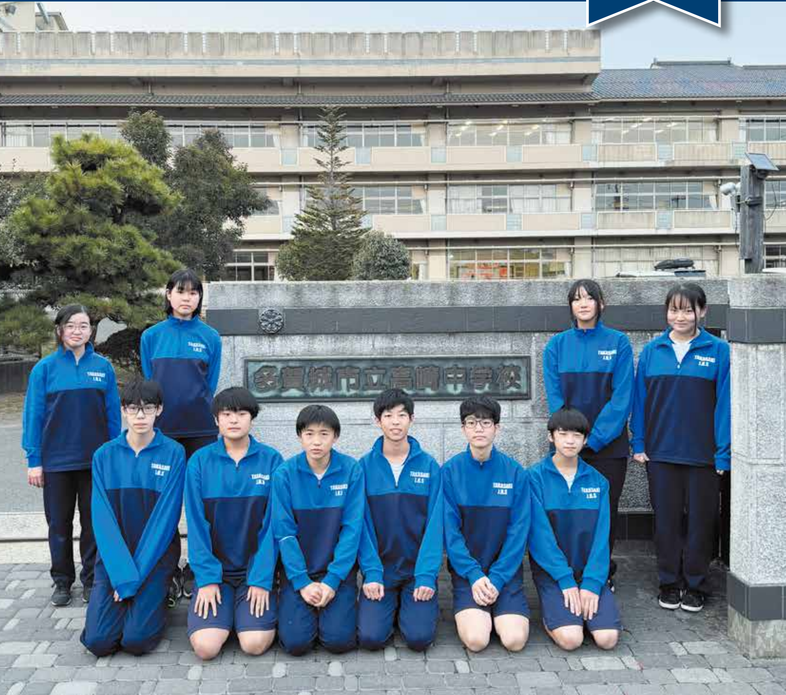
▲高崎中学校生徒会役員の皆さん

〒985-8531 宮城県多賀城市中央2-1-1 [電話 022-368-3053 FAX 022-368-1397]