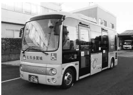
▲多賀城西部線運行バス

問2 市は新たに地球温暖化対策実行計画を策定されましたが、新たに進めようとする取組にはどんなものがありますか。 答2 令和6年4月から、これまで燃やせるごみとして収集